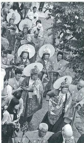
諸菩薩とお浄土へ