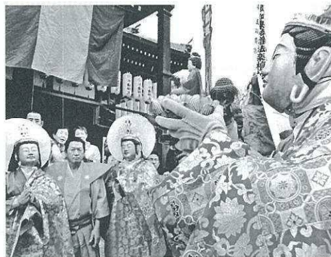
六観音・地藏・天童・菩薩の勢ぞろい