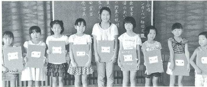
ティンカーベル結団式

また、団員もわずかですが、初めてのボランティア慰問活動は、12月21日(日)に高齢者施設「楽々園」と瀬戸内市民病院内の2カ所で、「クリスマスソングの贈り物」として手話曲も入れて6曲の歌を届けました。